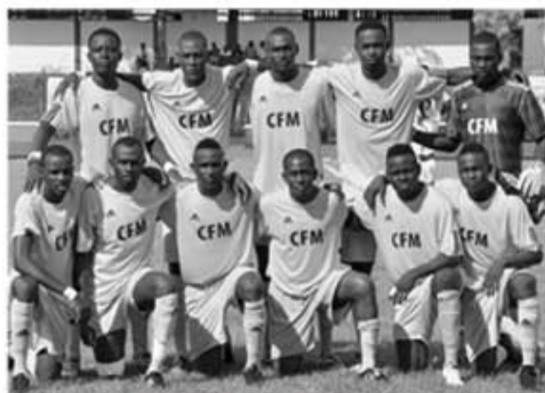
Le CF Mounana sorti victorieux face au Desportivo Da Huila d'Angola