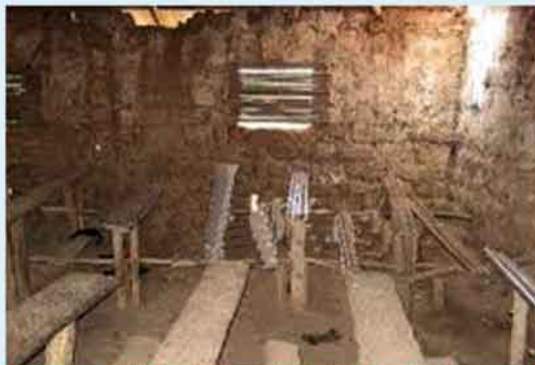
La réalité des structures abritant l'école gabonaise dans le pays profond et dans un univers où à peine 5% de la population profite réellement de la richesse nationale

Par ailleurs, la montée au créneau du Président de la République qui n'a laissé personne indifférent, peut être analysée sur le prisme politique, dans la mesure où, malgré le changement de Premiers Ministres et de gouvernements depuis son accession à la magistrature suprême, la vision d'Ali Bongo pour un Gabon émergent à l'horizon 2025, tarde à se concrétiser. Il faut rappeler qu'en quatre ans de pouvoir, le chef de l'Etat est à son troisième Premier Ministre (Paul Biyoghe Mba de 2009 à 2011, Raymond Ndong Sima de 2012 à 2014 et Daniel Ona Ondo depuis janvier 2014),