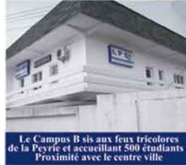
Le Campus B sis aux feux tricolores de la Peyrie et accueillant 500 étudiants : Proximité avec le centre ville