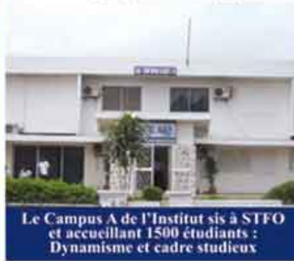
Le Campus A de l'Institut sis à STFO et accueillant 1500 étudiants : Dynamisme et cadre studieux

Avec ses 1200 lauréats depuis sa création, l'IHEM forme pour l'insertion directe des cadres supérieurs sur le marché de l'emploi. Il n'en demeure pas moins que les étudiants après le Master, puissent poursuivre leurs études en MBA et Doctorat à l'Institut.