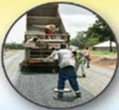
Aménagement de chaussées