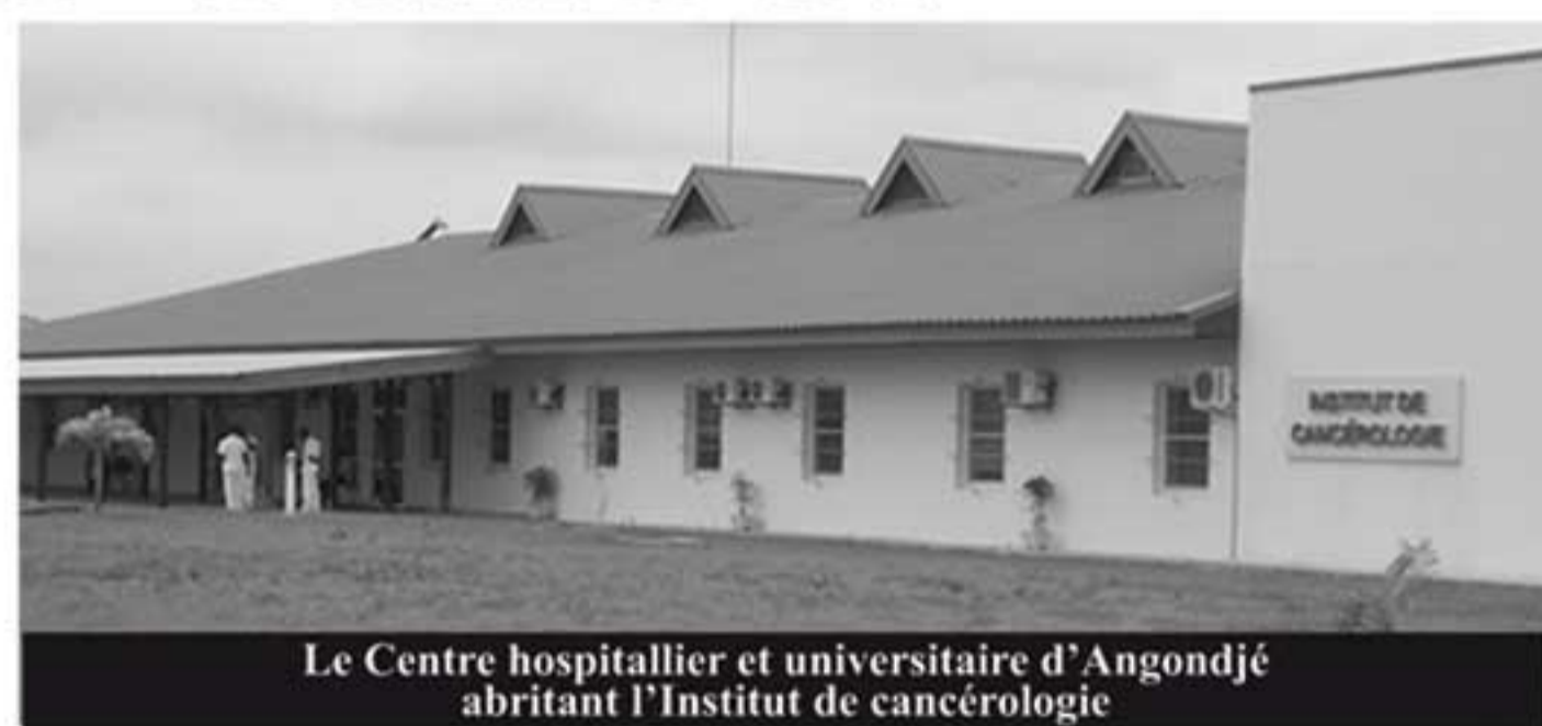
Le Centre hospitalier et universitaire d'Angondjé abritant l'Institut de cancérologie

L'Institut de cancérologie d'Angondjé qui vient d'être livré comprend également un service de chimiothérapie qui est un ensemble de traitements. Cet établissement a pour objectif d'améliorer la qualité des prestations de santé et de permettre aux patients de bénéficier d'un accès équitable aux soins. C'est une