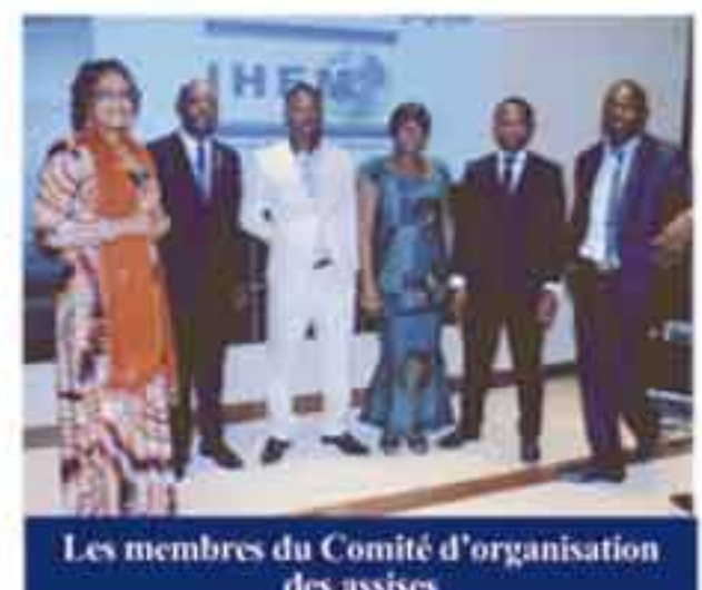
Les membres du Comité d'organisation des assises

Reportage de Dimitri AMVENE et Steve MOUNGUENGUI