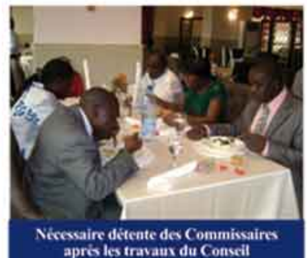
Nécessaire détente des Commissaires après les travaux du Conseil