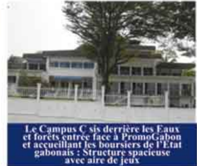
Le Campus C sis derrière les Eaux et forêts entrée face à PromoGabon et accueillant les boursiers de l'Etat gabonais : Structure spacieuse avec aire de jeux