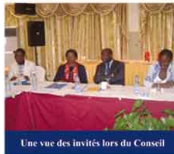
Une vue des invités lors du Conseil