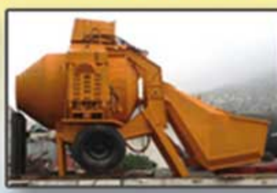
Bétonnière de chantier