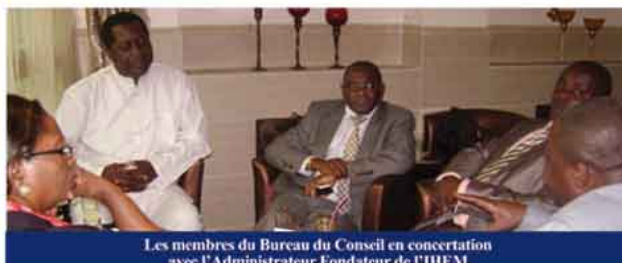
Les membres du Bureau du Conseil en concertation avec l'Administrateur Fondateur de l'IHEM