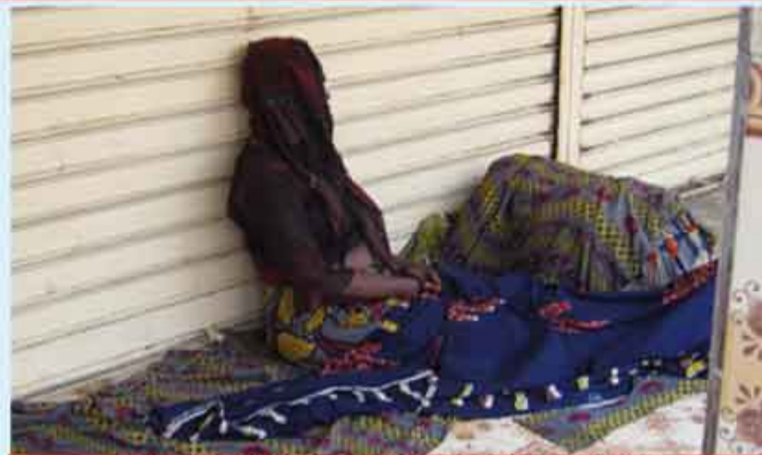
Une femme et son enfant dormant à la belle étoile dans les rues de Libreville : la solidarité et le partage semblent avoir mis la clé sous le paillasson

Après la nomination du Pr Daniel Ona Ondo au poste de Premier Ministre, et la formation d'un nouveau Gouvernement, le Président de la République, Chef de l'Etat, Ali Bongo Ondimba a prononcé une importante allocution devant un panel de personnalités, du Gouvernement de la République, de la haute administration, du Patronat, des confessions religieuses, de la société civile et des représentants diplomatiques du système des Nations unies.