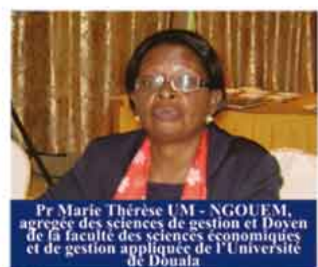
Pr Marie Thérèse UM - NGOUEM, agrégée des sciences de gestion et Doyen de la faculté des sciences économiques et de gestion appliquée de l'Université de Douala