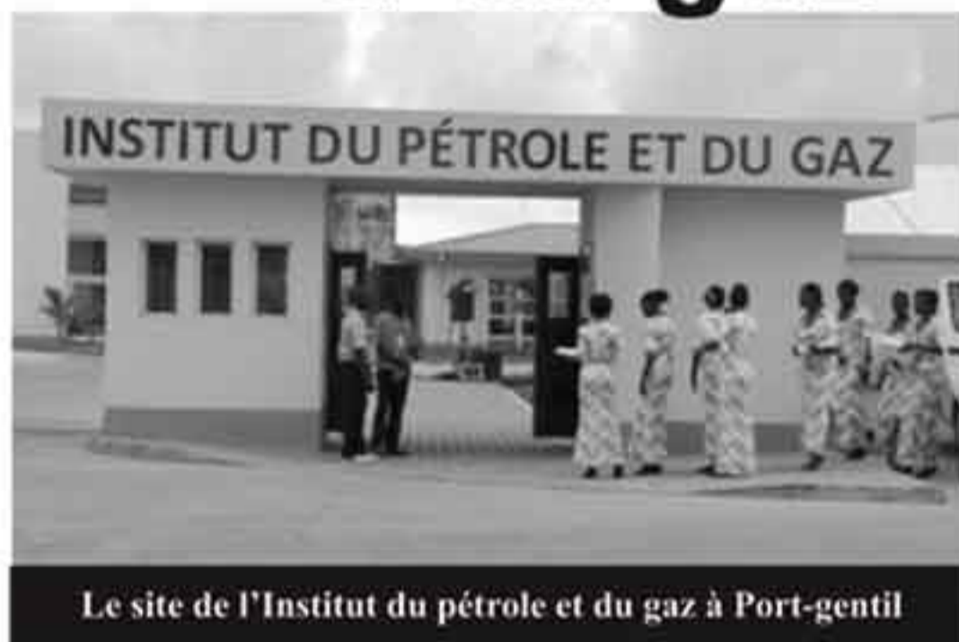
Le site de l'Institut du pétrole et du gaz à Port-gentil

Le Chef de l'Etat a récemment procédé à l'inauguration de l'Institut du Pétrole et du Gaz à port-gentil. C'est ici l'aboutissement de la décision qu'il avait prise lors du Conseil des ministres délocalisé de Port- Gentil de doter le Gabon d'un institut de pétrole. En effet, pendant ce Conseil des ministres dans l'Ile Mandji, le Président de la République avait décidé de la création au Gabon, d'un institut pour former les cadres gabonais dans les métiers du pétrole. Car, il est courant de constater que de nombreux compatriotes veulent travailler dans le domaine du pétrole mais n'ont pas toujours les qualifications requises pour exercer dans ce secteur d'activité. Créé en mars 2010 à