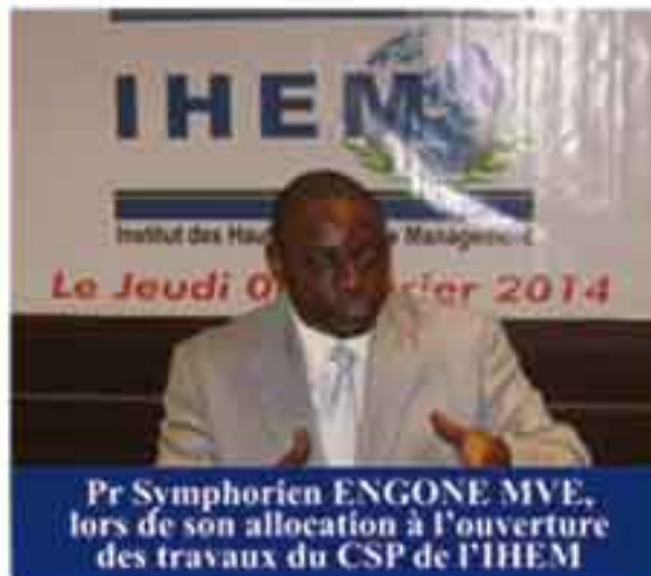
Pr Symphorien ENGONE MVE, lors de son allocution à l'ouverture des travaux du CSP de l'IHEM