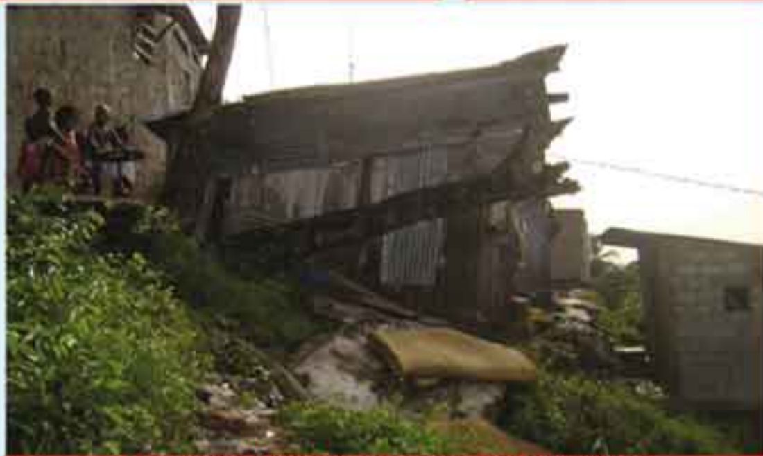
Un des nombreux taudis au cœur de Libreville : quand la précarité atteint son paroxysme dans un pays riche mais de seulement 1,5 millions d'habitants