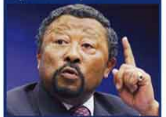
Jean Ping, Ancien Président de la Commission de l'Union africaine

« Je n'ai plus rien à voir avec le pouvoir en place »