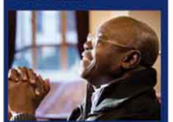
Pierre Akendengué, musicien gabonais

« Notre destinée c'est de vivre la liberté »